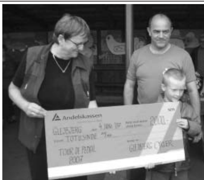
En overrasket men glad vinder, tænker vist på, hvad man skal investere de mange rare kroner i.

REGISTRERET REVISOR Stationsvej 9 - Vejrup - 6740 Bramming Tel.: 75 19 00 50 - Fax: 75 19 07 50 ingrid@ellegaard-revision.dk