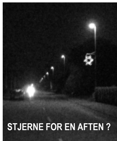
STJERNE FOR EN AFTEN ?

v/Søren Hougaard Telefon 75 19 61 55 & 61 36 71 27