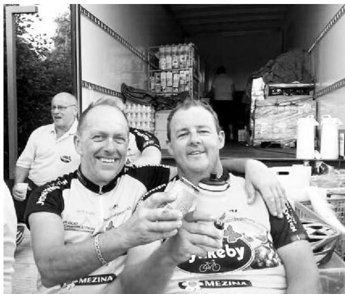
Halvvejs ved målet. Forfriskning på bagsmækken.

Her kommer krølsalat og solmodne tomater til kort.